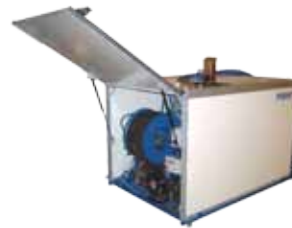
PPL 180/90 -K